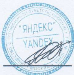
Лурье Е. В.

Заместитель Министра просвещения Российской Федерации